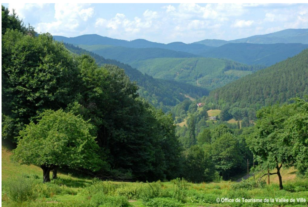
Vue depuis le Col de Fouchy